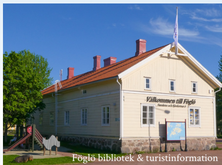
Föglö bibliotek & turistinformation

Degerby befolkades på 1400-talet, och växte sedan främst på grund av närheten till segelleden och de därmed förknippade verksamheterna inom tull, lots, handel och gästgiveri. Idag ser vi spår av dessa i de byggnader som finns samlade invid färjefästet. Tullens små packhus används idag av Föglömuseet och privata aktörer, tullvaktmästarens bostad inrymmer turistinformation och bibliotek. Den gamla väntsalen från 1920-talet ligger precis invid färjefästet och i lotsstugan finns en utställning öppen för allmänheten.